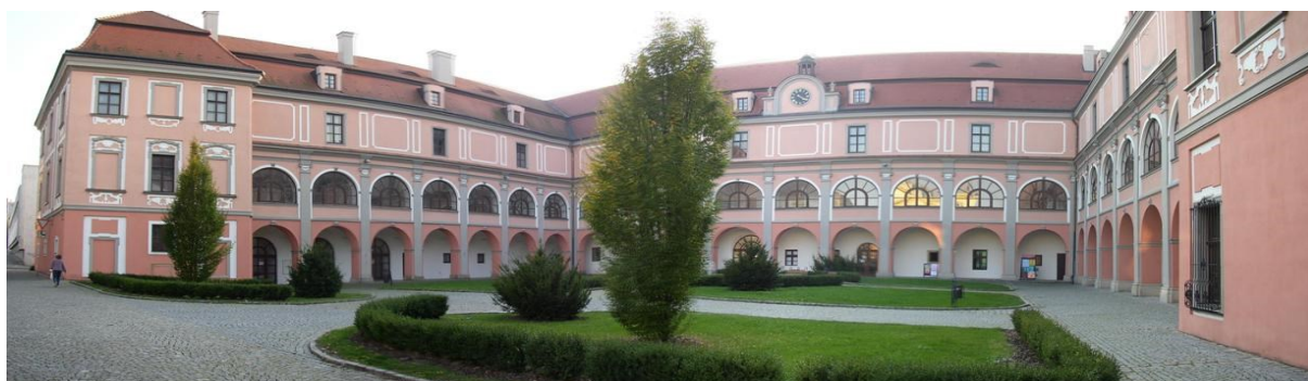
Žerotínský zámek ve Valašském Meziříčí

Navštívili jsme tam koncert pro tříkrálové koledníky, kde vystupovala zpěvačka Beata Bocek. Líbilo se mi, jak hezky zpívala. O této zpěvačce se můžete dočíst více informací na jiném místě tohoto časopisu.