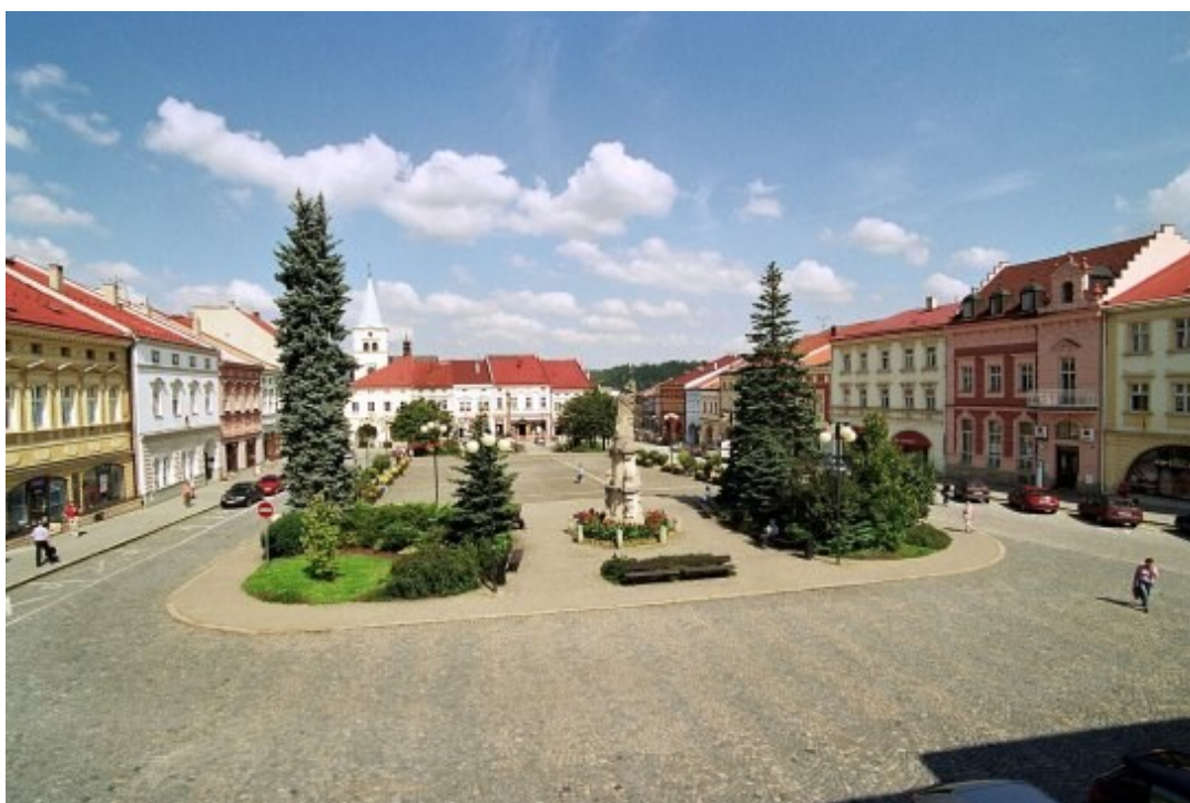
Náměstí ve Valašském Meziříčí

Svou polohou představuje vstupní bránu Moravskoslezských Beskyd a významný dopravní uzel. Někdy se Valašskému Meziříčí také říká Valašské Atény nebo jen zkráceně Valmez. Historické jádro města bylo v roce 1992 prohlášeno městskou památkovou zónou.