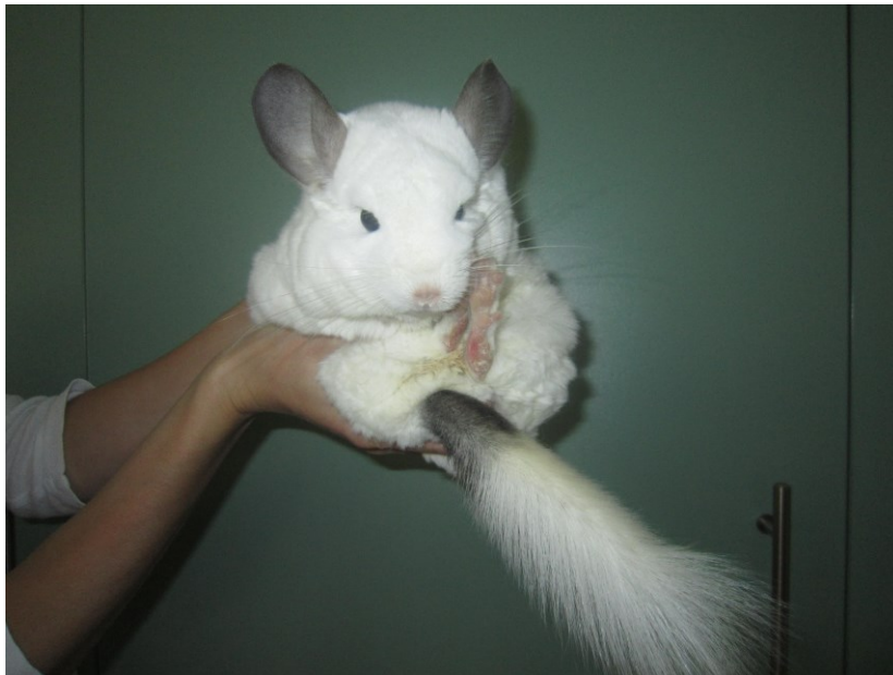
Naše činčila Sněhurka, kterou na Světlance chováme

Kdyby tady byla taková činčila, Která by mě chtěla, mládě vychovala, přitom hodná byla. Kdyby tady byla taková činčila, Která by mě měla ráda, Přitom ve mně spatřovala prima kamaráda.