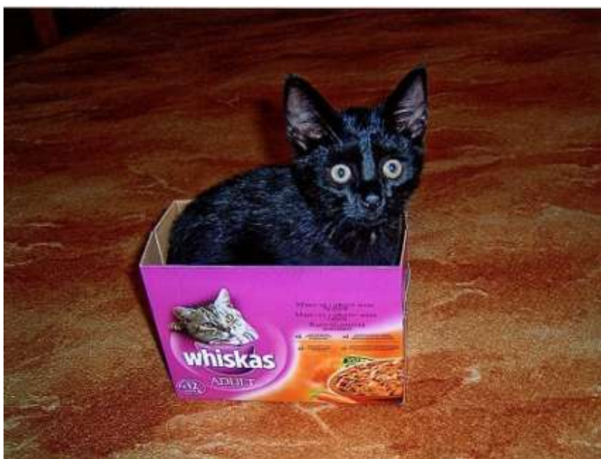
Kočka divoká – plavá

Každá kočka je originální, jak svou barevností, tak povahou.